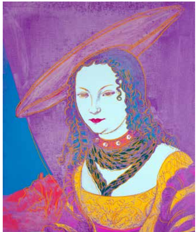
Andy Warhol „Portrait einer Frau (nach Lucas Cranach)“, 1984. Sammlung Bayer Leverkusen.